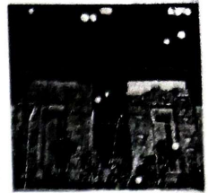
PALACIO DEL INKA SAYRI TUPAC

Que, la administración municipal está bajo la dirección y responsabilidad del Gerente Municipal y se sustenta en principios de programación, dirección, ejecución, supervisión, control concurrente y posterior, rigiéndose por principios de legalidad económica, transparencia, simplicidad, eficacia y eficiencia así lo precisan los Artículos 26° y 27° de la norma antes acotada. El Alcalde como titular del pliego ejerce competencia como obligación propia conferida por la misma Ley Orgánica salvo el cambio de esta misma en otro órgano jerárquicamente inferior por motivo de delegación de la competencia la Gerencia Municipal es el máximo órgano administrativo en relación de dependencia directa del alcalde;