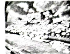
PLAZA MANCO II YUCAY