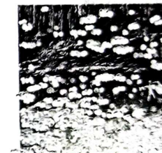
PINTURAS EN PARED